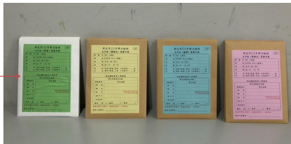
▲ 國語文(黃色)、數學(藍色)、英語文(粉紅色)、問卷(綠色)